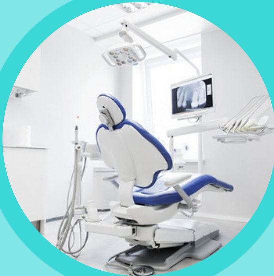
BỘ DỤNG CỤ NHA KHOA