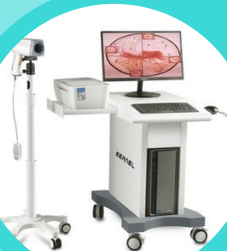
MÁY NỘI SOI CỔ TỬ CUNG