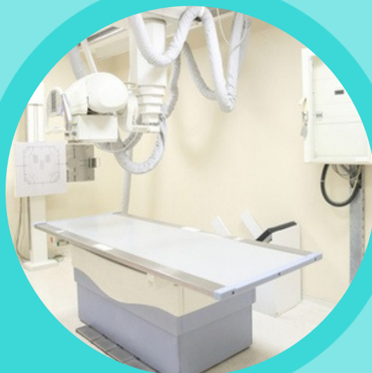
MÁY X-QUANG KỸ THUẬT SỐ