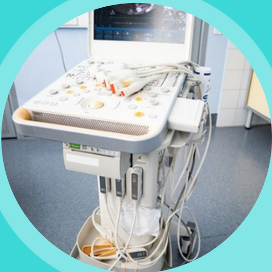
MÁY SIÊU ÂM MÀU 4D