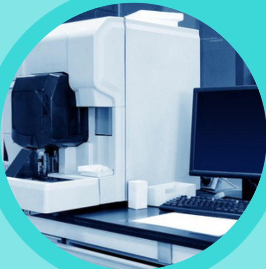
MÁY XÉT NGHIỆM HUYẾT HỌC