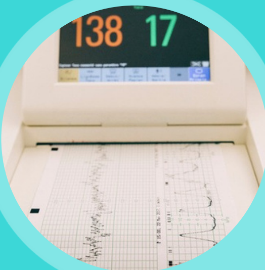
MÁY ĐO ĐIỆN TIM