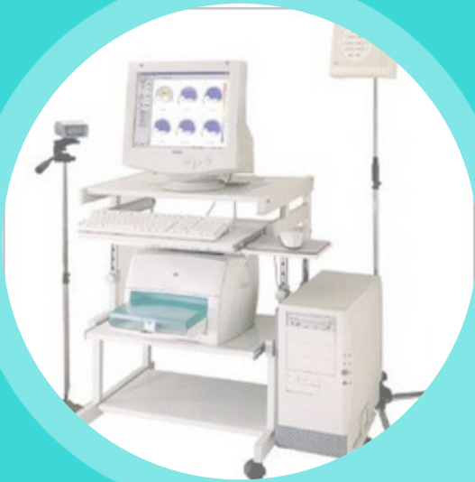
MÁY ĐO ĐIỆN NÃO ĐỒ