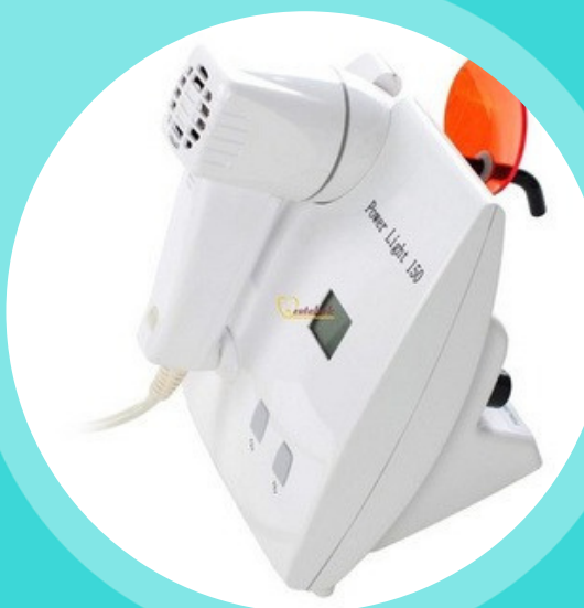
ĐÈN TRÁM HALOGEN