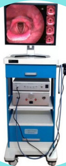
MÁY NỘI SOI TAI MŨI HỌNG